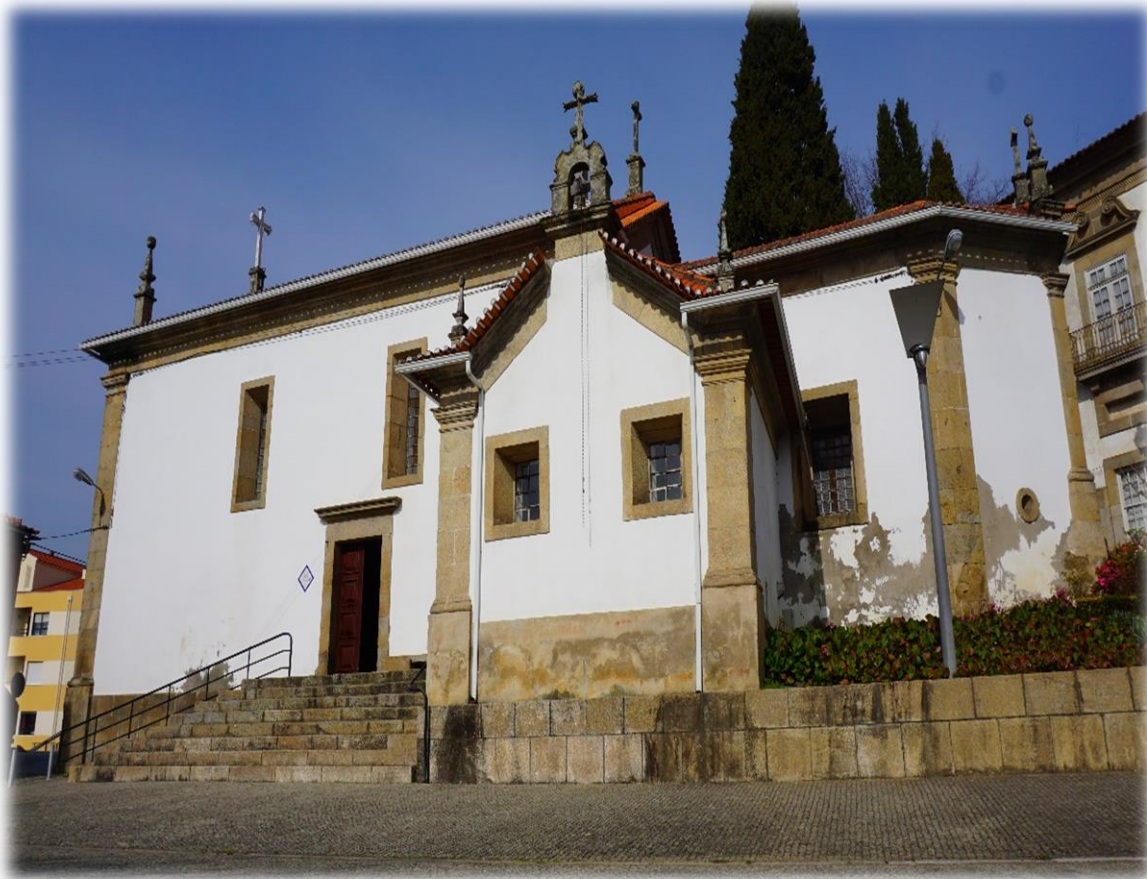
Igreja Matriz de S. Pedro