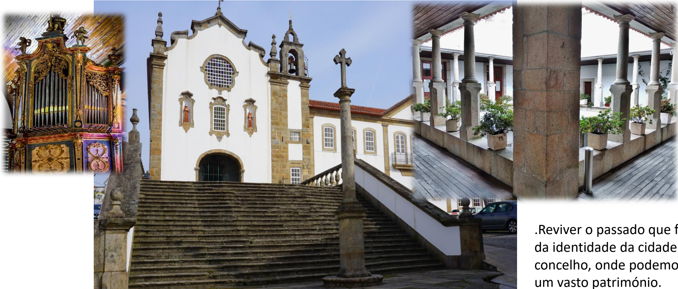
Convento Franciscano de S. José- Imóvel de Interesse público

.Reviver o passado que faz parte da identidade da cidade e do concelho, onde podemos apreciar um vasto património.