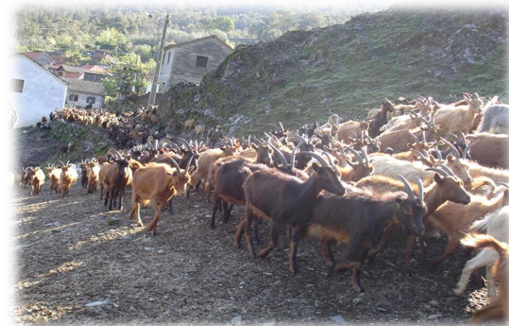
Covas do Monte, onde o grito dos pastores ecoa pela serra!