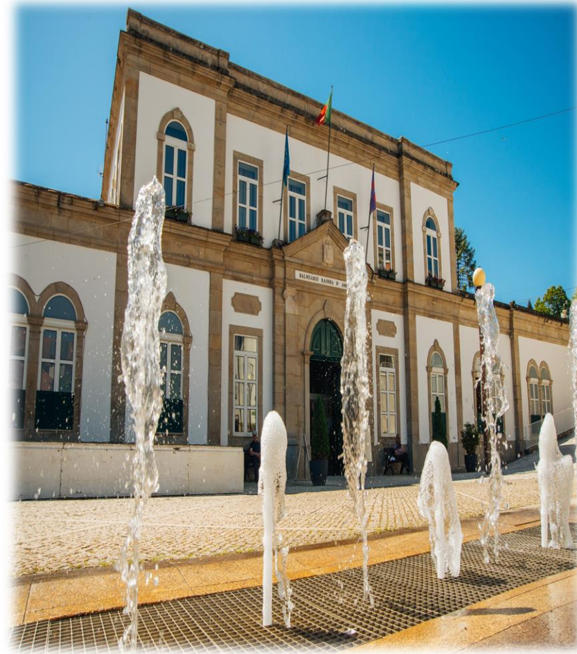
Balneário Rainha D. Amélia