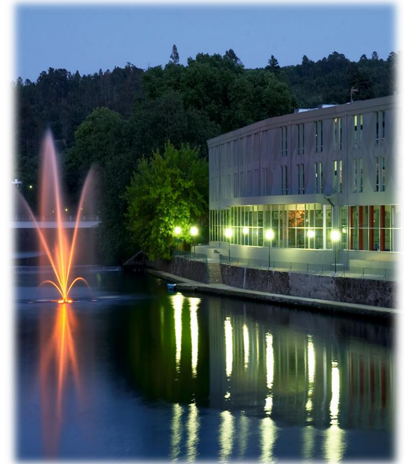
Balneário D. Afonso Henriques