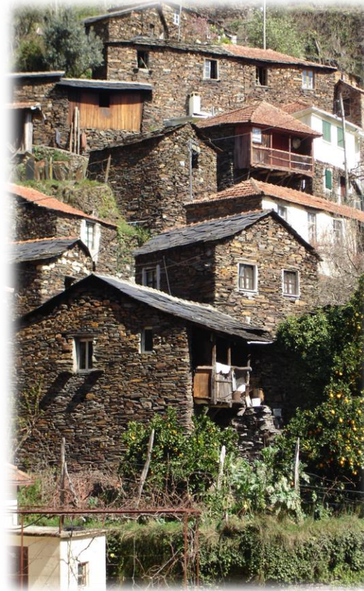
Património Cultural Aldeias típicas | Aldeias de Xisto