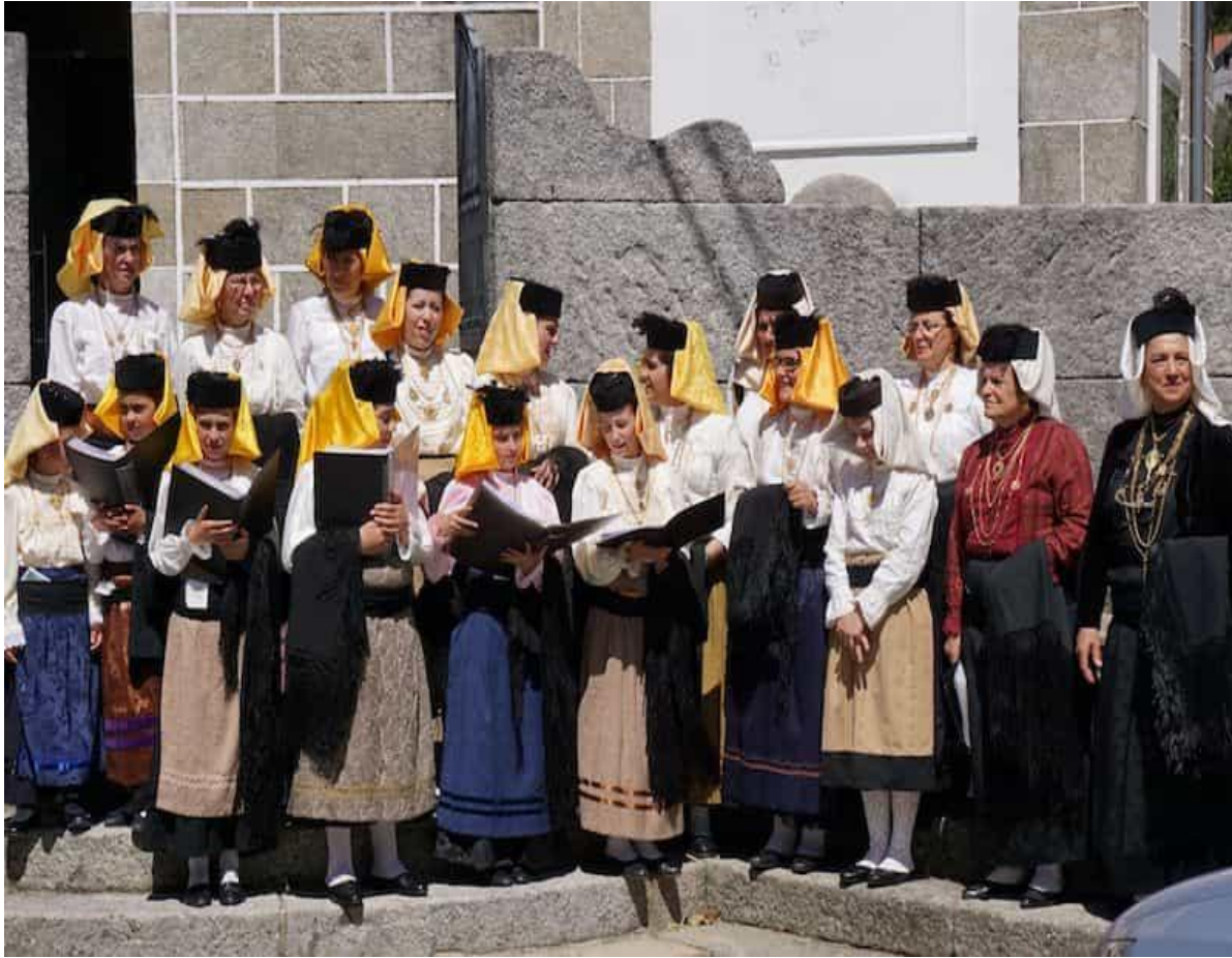
Aldeia tradicional de Manhouce